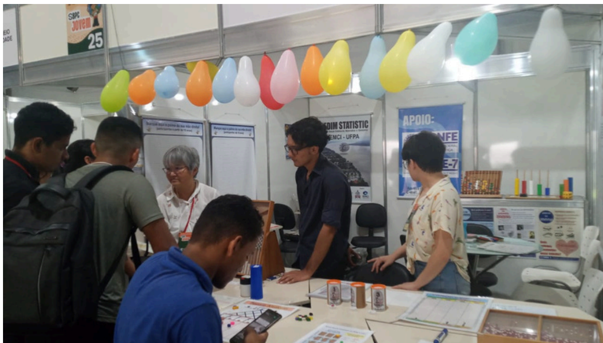
Tenda da Estatística na UFPA