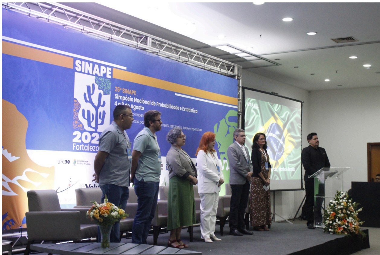
Cerimônia de Abertura